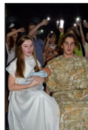
Tak było rok temu ...

Raz w roku rozchyłam ufnie bożonarodzeniowe gałązki słów